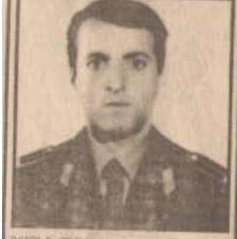
ՄԻՈՒՐՈՒՄ ԳՅՈՒՆՆԱՅԻՆՈՒՄ 21 թիվը 1922 թվականի 29 ապրիլի 1 կինոյի կազմակերպչական կոմիտեի կողմից հաստատված էր: Մեծ հայրենի պատերազմի ժամանակ Ս. ԳՅՈՒՆՆԱՅԻՆՈՒՄը ծառայել է Խորհրդային կարմիր բանակում: