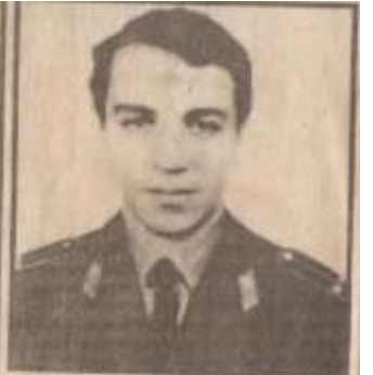
ՄԻՈՒՐՈՒՄ ԳՅՈՒՆՆԱՅԻՆՈՒՄ 21 թիվը 1922 թվականի 29 ապրիլի 1 կինոյի կազմակերպչական կոմիտեի կողմից հաստատված էր: Մեծ հայրենի պատերազմի ժամանակ Ս. ԳՅՈՒՆՆԱՅԻՆՈՒՄը ծառայել է Խորհրդային կարմիր բանակում: