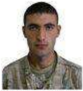
კლასის რიგითი გვიად სულხანიძევილი

რუსეთ-საქართველოს ომი — ასევე ცნობილი როგორც 2008 წლის სამხრეთ ოსეთის ომი, შეიარაღებული კონფლიქტი 2008 წლის აგვისტოში, ერთი მხრივ საქართველოსა და მეორე მხრივ რუსეთის ფედერაციას შორის, ოსებსა და აფხაზებთან ერთად.