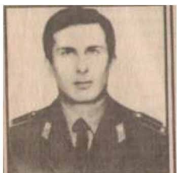
მალაქიძე ნათარჯიშვილი 24 წლის დაიბადა 1911 წლის 28 იანვარს საბჭოეთში, სკკპ-ის შუბელში. დაიბადა და დაიბადა შს აკადემიის მე-4 კურსის III ოცნების II ოცნების მეორე მისი სხელი.