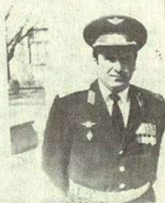
ივან ცერცვაძის ფოტო

1992 წლიდან დაღუპვის დღემდე სათავეში ედგა სამხედრო-სამაერო ძალებს, მისი უშუალო ხელმძღვანელობით შეიქმნა საქართველოს რესპუბლიკის სამხედრო-სამაერო ძალები, სადაც დიდი სიყვარულითა და პატივისცემით სარგებლობდა მძლავრ დონის პროფესიონალი, საავიაციო საქმის კარგად მცოდნე, დიდი პრაქტიკული გამოცდების მქონე მფრინავი.