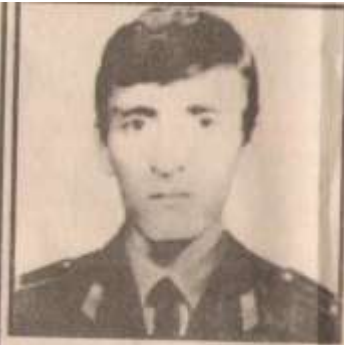
ՄԻՈՒՐՈՒՄ ԳՅՈՒՆՆԱՅԻՆՈՒՄ 21 թիվը 1922 թվականի 29 ապրիլի 1 կինոյի կազմակերպչական կոմիտեի կողմից հաստատված էր: Մեծ հայրենի պատերազմի ժամանակ Ս. ԳՅՈՒՆՆԱՅԻՆՈՒՄը ծառայել է Խորհրդային կարմիր բանակում: