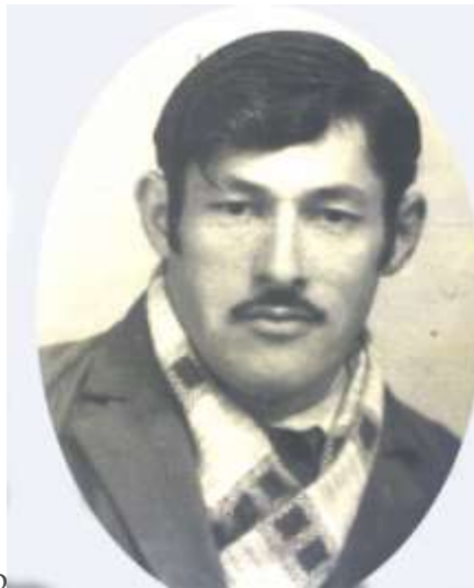
მე-8 ბატალიონის III ასეული